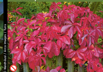
⊘ Gewöhnliche Jungfernnrebe ( Parthenocissus inserta )