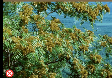
⊗ Götterbaum ( Ailanthus altissima )