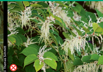
⊗ Japanischer Knöterich, Sachalin-Knöterich und Hybride ( Reynoutria japonica , R. sachalinensis )