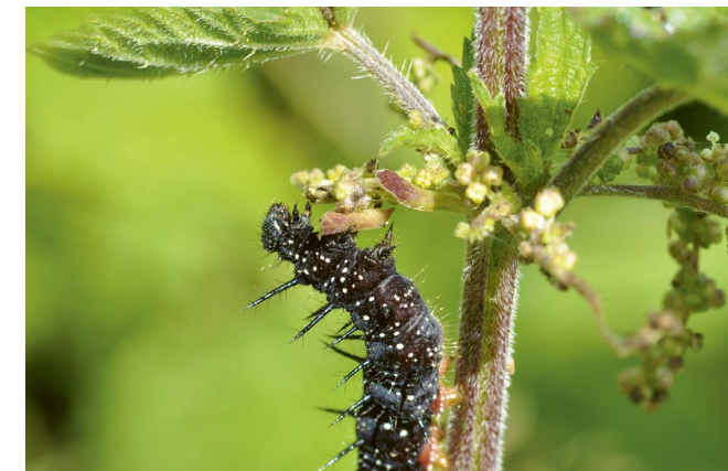
Einheimische Wildpflanzen dienen im Gegensatz zu Neophyten zahlreichen Arten als Nahrungsquelle.

Exotische Pflanzen mögen dekorativ aussehen, sind für viele Tiere hier aber nutzlos. Über Jahrmillionen haben sich Tiere und Pflanzen, die in einem Biotop zusammenleben, aneinander angepasst. Gebietsfremden Pflanzen fehlt diese gemeinsame Entwicklung. Der Rote Hornstrauch oder Hartriegel ( Cornus sanguinea ) zum Beispiel bietet Nahrung für mindestens 8 Wildbienen-, 24 Vogel- und 8 Säugerarten, während das exotische Pendant, der Seidige Hornstrauch ( Cornus sericea ), nur gerade für 2 Vogelarten interessant ist. Ein Vergleich zwischen zwei Arten aus der Familie der Rosengewächse zeigt: 48 Vogelarten picken die Früchte der Süsskirsche ( Prunus avium ), jedoch nur 3 jene des invasiven Kirschlorbeers ( Prunus laurocerasus ). Bei Neophyten ohne heimische Verwandte, wie etwa dem Essigbaum ( Rhus typhina ), sieht die Bilanz noch schlechter aus. Mit einheimischen Pflanzen wird Ihr Garten zu einer Oase des Wohlbefindens, wo Tiere Nahrung und Unterschlupf