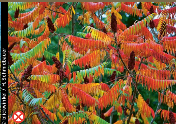
⊗ Essigbaum, Sumach ( Rhus typhina )