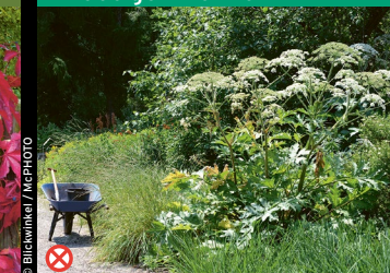
⊗ Riesen-Bärenklau ( Heracleum mantegazzianum )