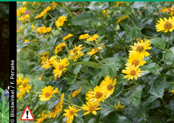
⚠ Topinambur, Knollige Sonnenblume ( Helianthus tuberosus )