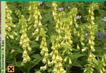
Gelber Fingerhut ( Digitalis lutea )