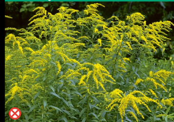
⊗ Kanadische Goldrute, Spätblühende Goldrute ( Solidago canadensis und S. gigantea )