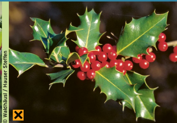
Stechpalme [immergrün] ( Ilex aquifolium )