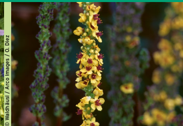
Dunkle Königskerze ( Verbascum nigrum )