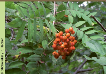
Vogelbeerbaum, Eberesche ( Sorbus aucuparia )