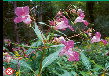
⊗ Drüsiges Springkraut ( Impatiens glandulifera )