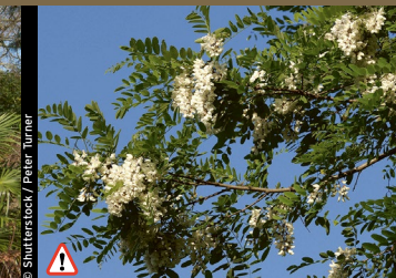
⚠ Robinie, Falsche Akazie ( Robinia pseudoacacia )