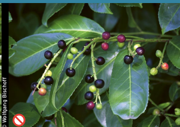
⊘ Kirschlorbeer [immergrün] ( Prunus laurocerasus )