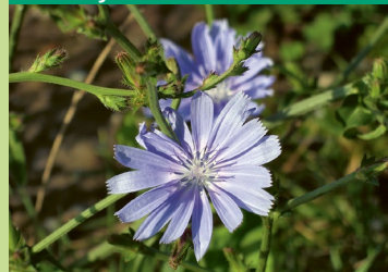
Wegwarte, Zichorie ( Cichorium intybus )