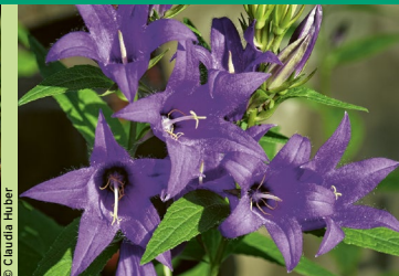
Nesselblättrige Glockenblume ( Campanula trachelium )