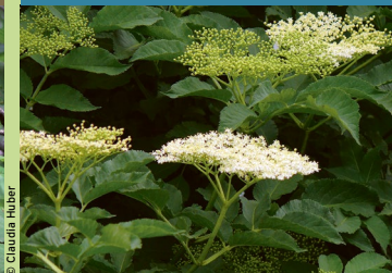
Schwarzer Holunder ( Sambucus nigra )