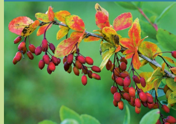
Gemeine Berberitze, Sauerdorn ( Berberis vulgaris )