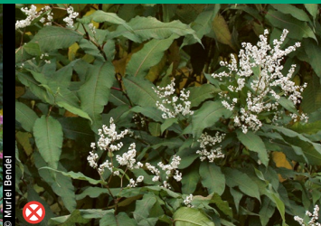
⊗ Vielähriger Knöterich ( Polygonum polystachyum )