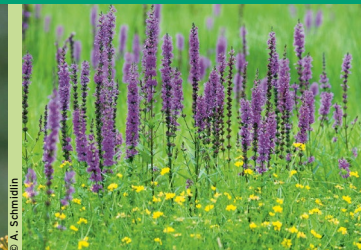
Blut-Weiderich ( Lythrum salicaria )