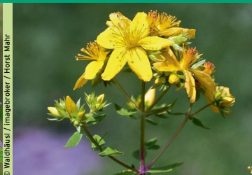
Echtes Johanniskraut, Gewöhnliches Johanniskraut ( Hypericum perforatum )