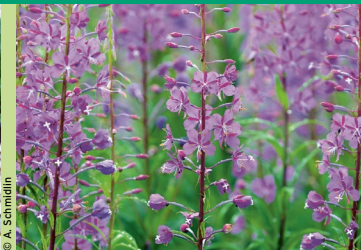
Wald-Weidenröschen ( Epilobium angustifolium )