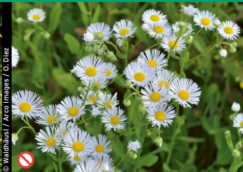
⊘ Einjähriges Berufskraut ( Erigeron annuus )