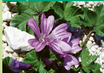
Wilde Malve ( Malva sylvestris )