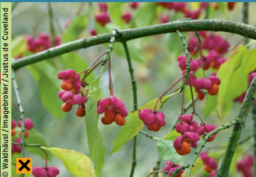
Gemeines Pfaffenhütchen, Gemeiner Spindelstrauch ( Euonymus europaeus )