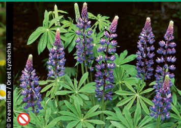
⊘ Vielblättrige Lupine ( Lupinus polyphyllus )