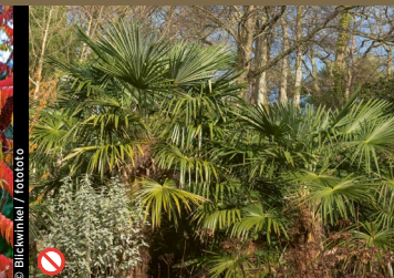
⊘ Fortunes Hanfpalme ( Trachycarpus fortunei )