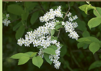
Gewöhnliche Traubenkirsche ( Prunus padus )