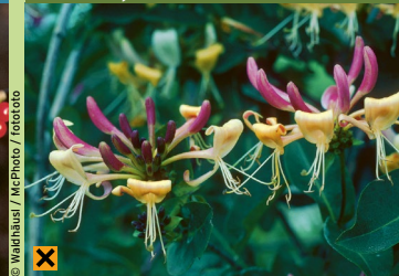
Wald-Geissblatt, Windendes Geissblatt ( Lonicera periclymenum )